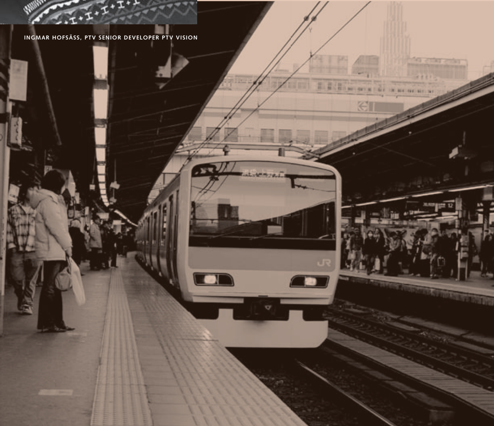
INGMAR HOFSAÄSS, PTV SENIOR DEVELOPER PTV VISION

„Es ist für uns eine große Motivation, dass unsere Software die Verkehrsplaner und Verkehringenieure in aller Welt unterstützt, die richtigen Entscheidungen zu treffen – ganz besonders dann, wenn der Verkehr für große Veranstaltungen, wie die Fußball-WM in Berlin oder für die Olympischen Spiele in Peking optimiert wird.“